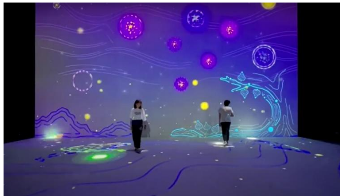
國立臺灣科學教育館小黑盒劇場