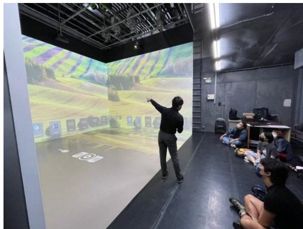
國立臺灣大學實驗劇場