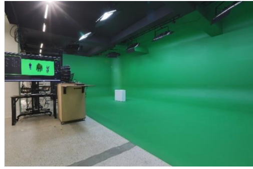
國立成功大學智慧體育館(中正堂)及數位虛擬攝影棚