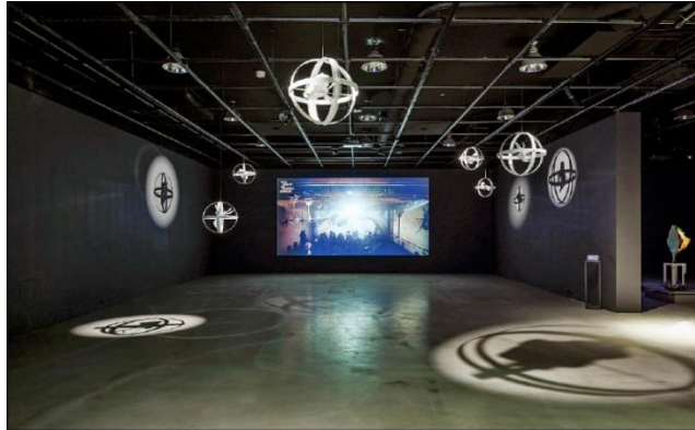
國立臺北藝術大學科技藝術館