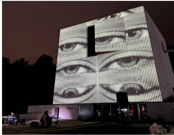
國立臺南藝術大學漢寶德紀念館